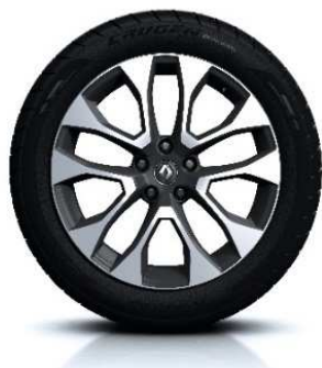
Aluminijski naplatci 19" Proteus