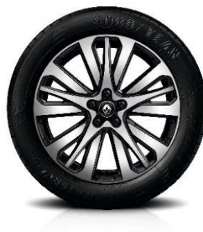
Aluminijski naplatci 19" Initiale Paris